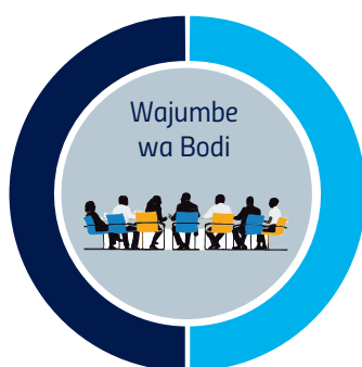
Jedwali na. 7